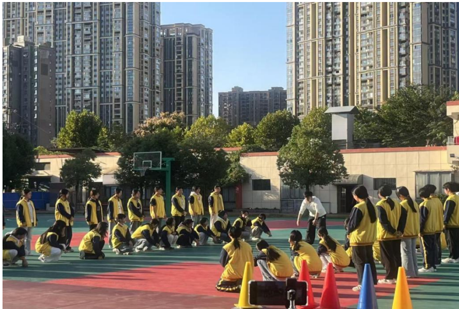
图 2-6 “启迪智慧，共享精彩”公开课