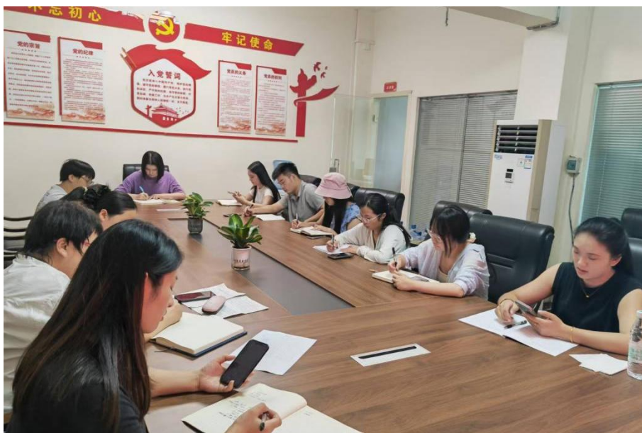
图 8-3 职教出海主题会议

首年合作的成功，为项目的长期稳定发展注入了强大信心。武汉助产学校计划在2026年，进一步扩大交流规模，“探讨启动学生短期互换、邀请日方专家来校讲学”等更深层次的互动。学校将继续秉持开放、合作、共赢的原则，让“职教出海”之船行稳致远。