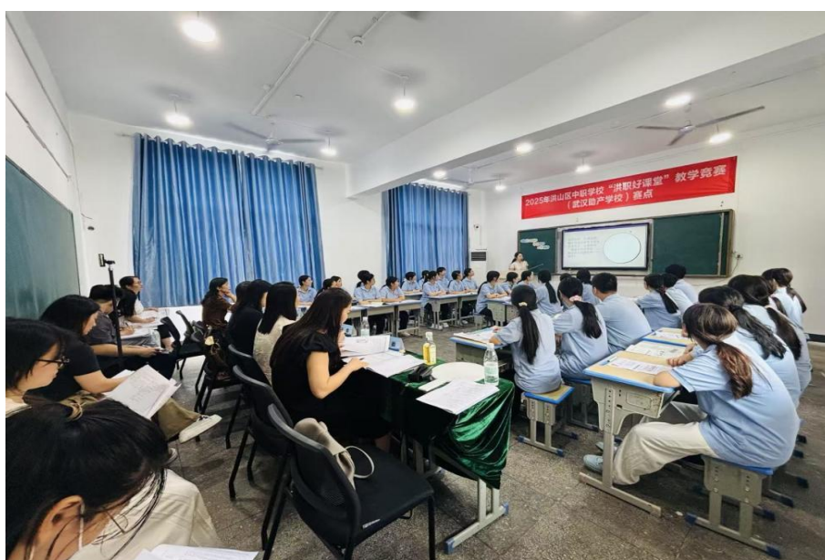
图 2-5 2025 年洪山区中职学校“洪职好课堂”比赛