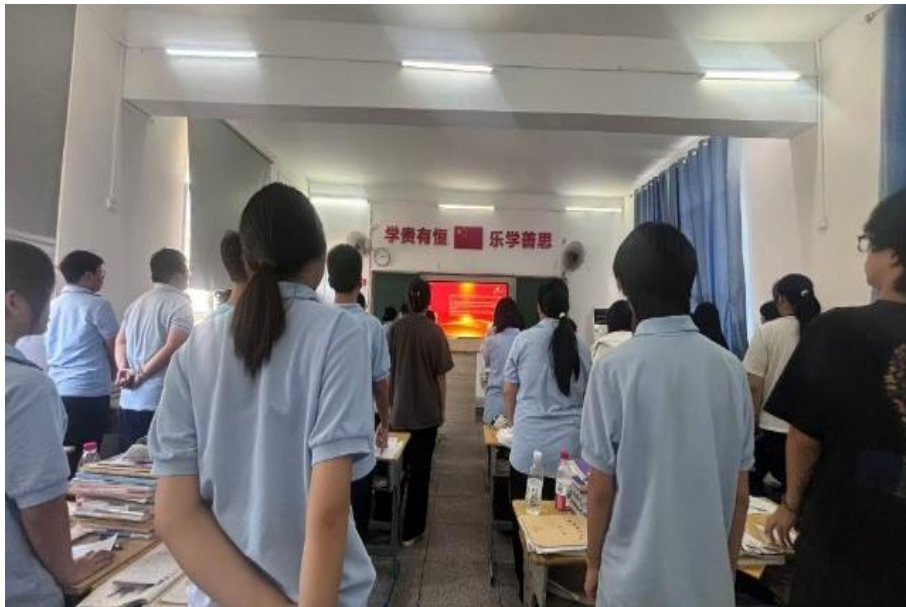
图 4-9 “国家共同体”班会活动现场