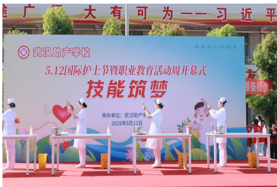
图 4-5 学生代表进行无菌铺盘技能展示