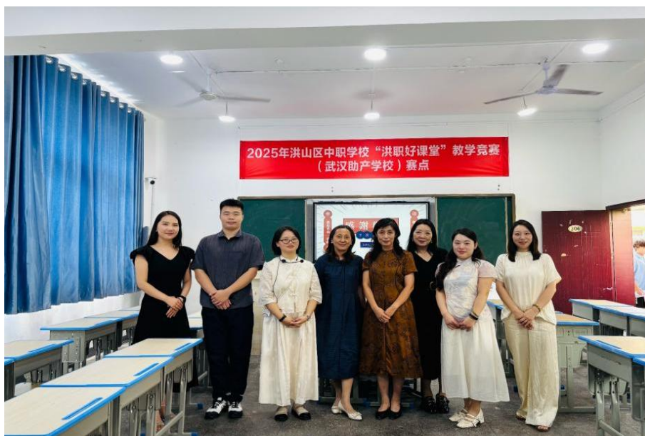
图 2-16 2025 年洪山区中职学校“洪职好课堂”获奖教师