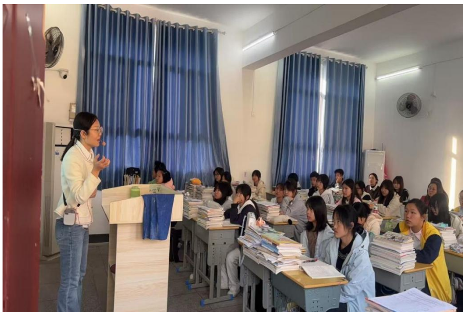
图 2-7 洪山区教科院教研员莅临学校开展教学指导活动