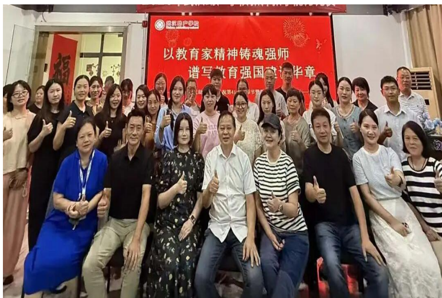
图 4-3 “以教育家精神铸魂强师，谱写教育强国建设华章”教师节活动

此次大会凝聚教职工向心力，既明确了教师队伍发展路径，又强化了服务育人的保障能力，为学校深耕中职教育、培养新时代医护人才，以及助力教育强国与医疗事业的发展奠定了坚实基础。