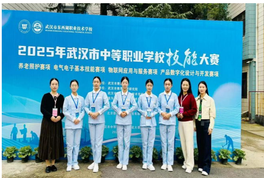
图2-10 教师及学生技能大赛获奖

学校鼓励学生参加各类技能竞赛，通过竞赛激发学生的创新精神和实践能力。在“2025年武汉市中等职业学校护理技能大赛”中，学校学生表现出色，获得了多个奖项。