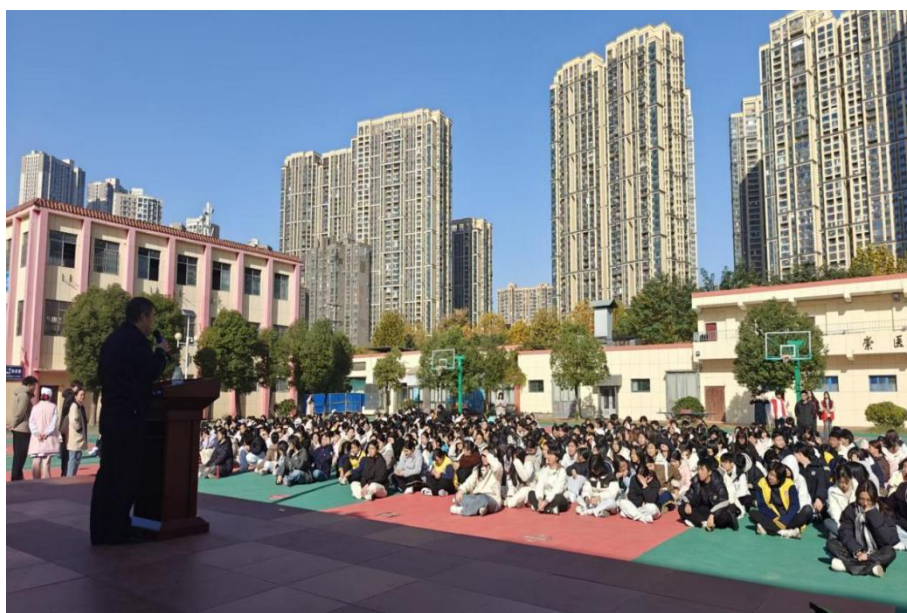
图 2-12 同学们席地而坐，专注聆听夏警官宣讲

对于如何有效保护自身安全，夏警官给出了“三要诀”：一是要保持冷静，避免激怒对方；二是要及时求助，第一时间向老师、家长或警方报告；三是要保留证据，如聊天记录、视频资料等，为后续处理提供依据。同时，学校还设立了心理咨询室，为遭受霸凌的学生提供心理疏导和帮助。