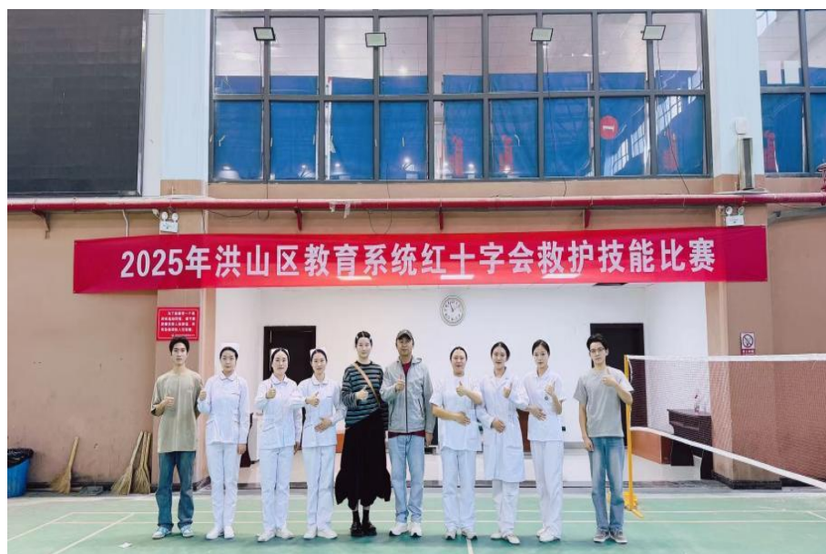
图 2-14 学校护理教师和学生参加红十字会救护技能比赛

位，更能挺身于危急时刻，以专业的技能守护生命、服务社会。 师生们用行动宣告：掌握精湛技能的职教学子，同样是社会的中 流砥柱，职业教育天地广阔，未来大有可为