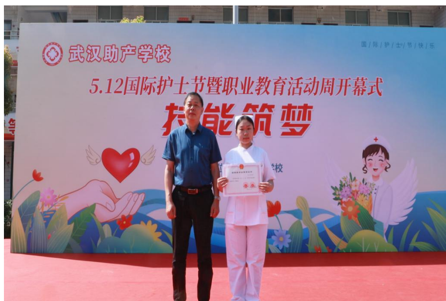
图 4-6 校领导为国家级奖学金获得者颁发荣誉证书