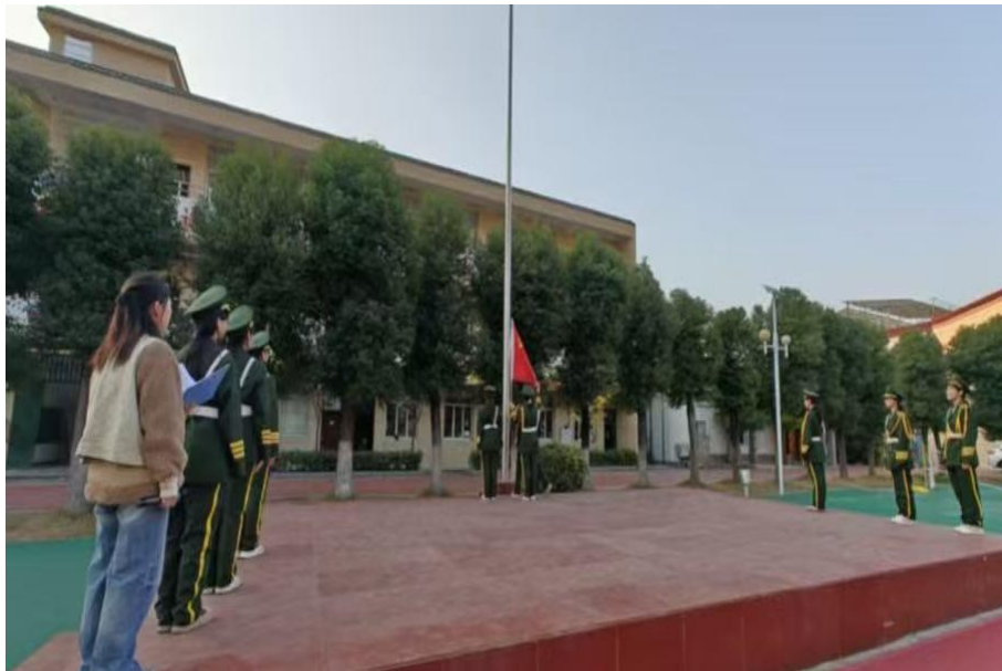
图 2-1 国旗护卫队负责每周一升国旗