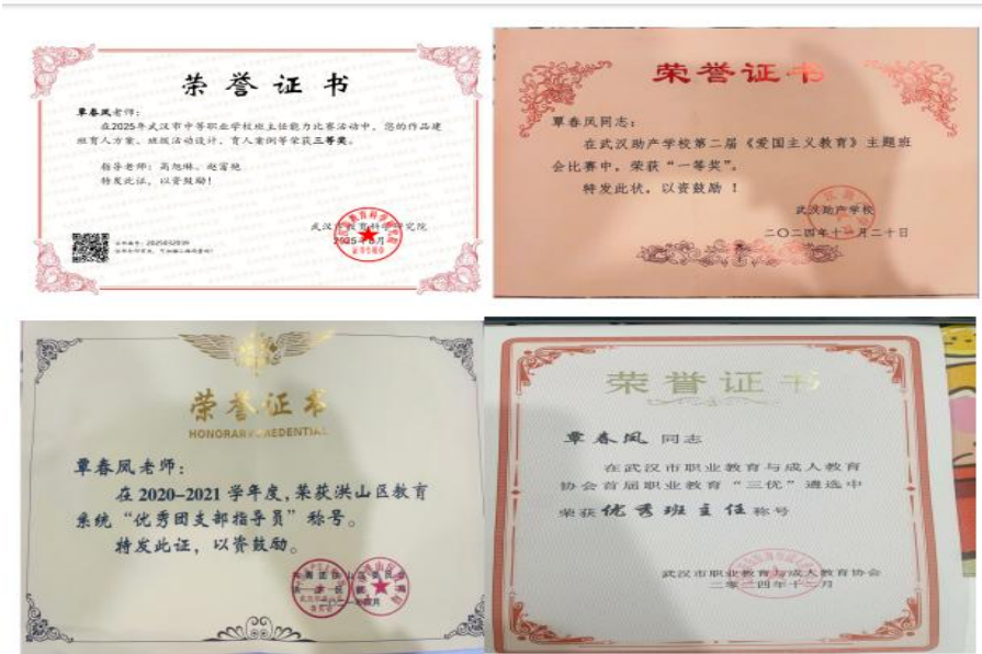
图 10-2 优秀教育工作者覃春风同志荣获相关奖项

在专业化发展道路上，她获得 2025 年市级班主任能力大赛三等奖，将竞赛中的先进理念与实践经验融入工作室建设，通过经验分享、结对帮扶等方式指导青年教师，发挥示范辐射作用，助力全校班主任队伍专业提升。在学工处统筹工作中，她牵头构建科学规范的学生管理与德育工作体系，推动管理流程优化、育人资源整合，以系统性创新举措提升全校育人实效，用责任与智慧诠释了爱岗敬业、潜心育人的职业担当，为学校高质量发展注入强劲动力。