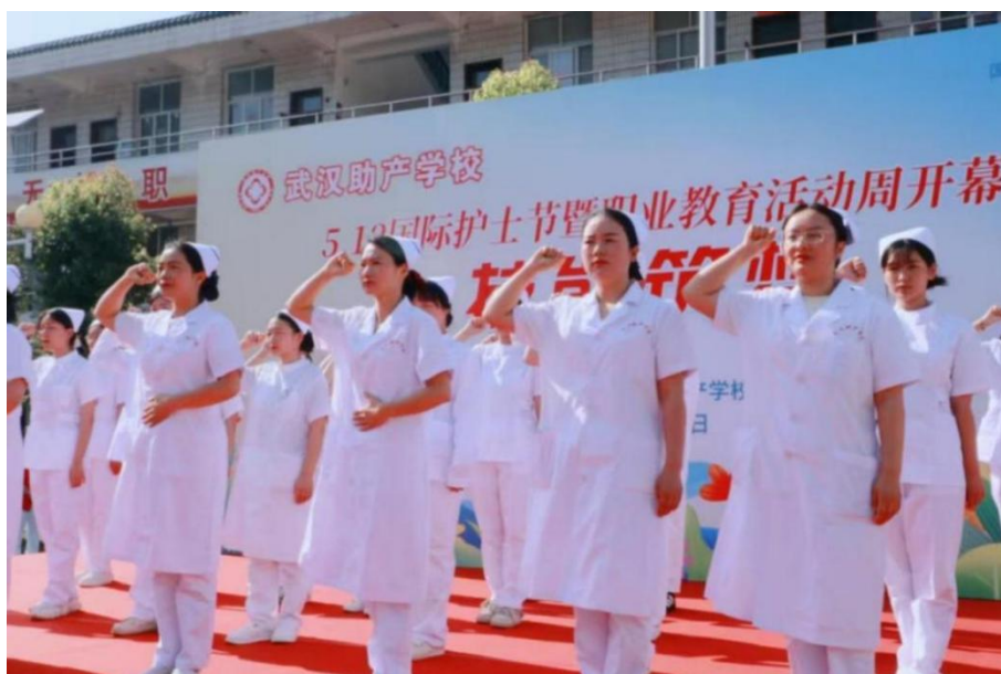
图 4-8 “5.12 护士节”主题活动现场（二）