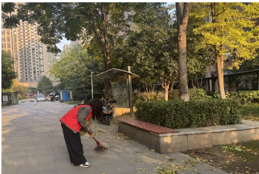
图 3-5 杨晶老师开展清扫工作

武汉助产学校以入党积极分子实践为核心抓手，构建志愿服务常态化机制，让公益行动扎根日常、惠及民生。杨晶、覃春风两位老师作为先锋代表，自成为入党积极分子以来，始终将志愿服务融入生活，累计参与爱心义诊、健康科普、环境卫生清扫等公益活动超 60 小时。她们定期带队走进社区，既开展垃圾分类宣传、楼道清洁等便民服务，又发挥专业优势普及母婴护理、慢病管理等健康知识，以固定频次、多元内容筑牢常态化服务根基。这种“党建引领 + 专业赋能 + 基层实践”的模式，既生动践行了“为人民服务”的宗旨，更让党员先锋力量持续温暖社区，成为学校对接地方需求、服务民生发展的坚实纽带。