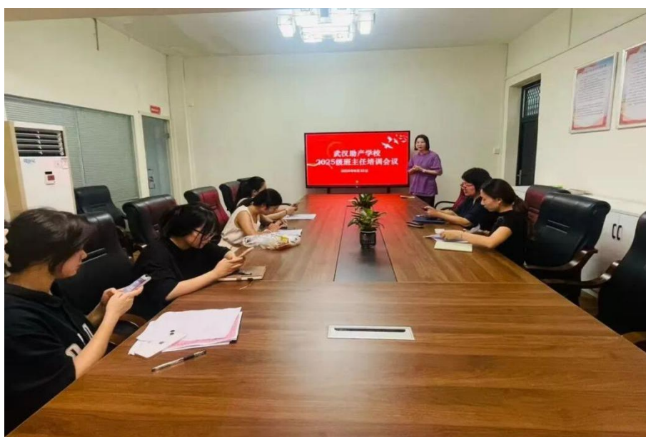
图2-3 新老班主任经验传承交流现场

动，邀请工作室的核心成员将多年带班“秘籍”倾囊相授。活动中，拥有数十年带班经验的老师动情地分享相关案例并强调：班主任工作“爱与责任是基石”，要善于用“显微镜”发现学生的优点，用“放大镜”看待学生的进步，更要懂得“严在当严处，爱在细微中”。她将精心整理的《班级管理日志》和《家校沟通案例集》赠予新任班主任们，字里行间凝聚着多年的心血与智慧。新任班主任都纷纷表示，前辈的经验如同“及时雨”，为自己即将开始的班主任工作指明了方向。她们将郑重接过这份沉甸甸的嘱托，虚心学习，勤于实践，尽快将所学内化为自己的带班能力。此次“暖心分享”活动，不仅是一次经验的传递，更是一种教育情怀的延续。为新班主任迅速成长搭建坚实桥梁的同时，还为学校育人工作的持续发展注入了源源不断的活力。相信在这份薪火相传的守护下，学校的教育事业必将更加枝繁叶茂，硕果累累。