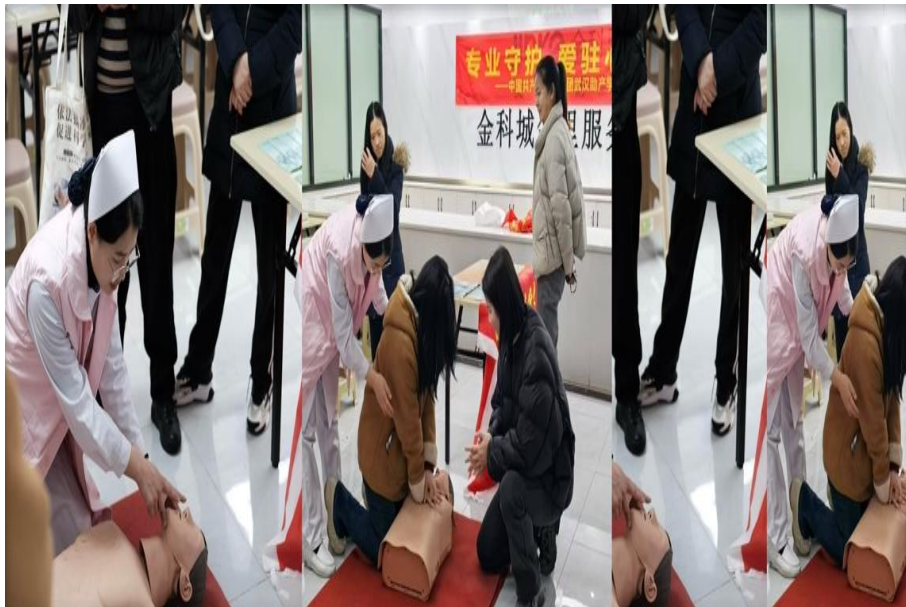
图 3-2 席西老师耐心讲解，社区志愿者认真练习心脏复苏实操

5.慢性病管理普受欢迎。在系列活动中，慢性病管理内容受居民欢迎，在血压检测区，5组“师生搭档”流水线作业：学生负责测量、记录，老师负责解读、指导，对 27 例血压 \geq 140/90\text{mmHg} 的居民，并帮助社区建立“社区一家庭”两方随访档案。