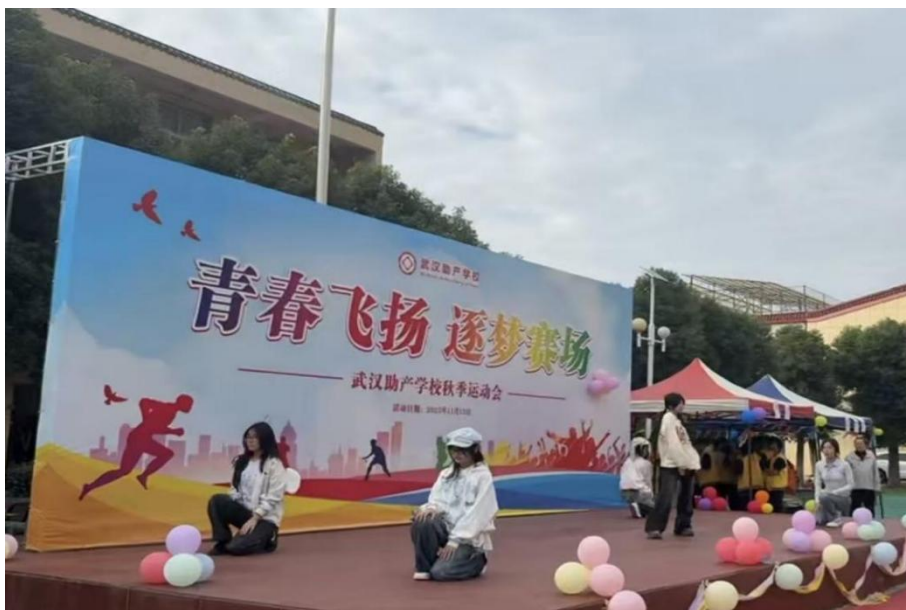
图2-2 舞蹈社团激情助威学校秋季运动会