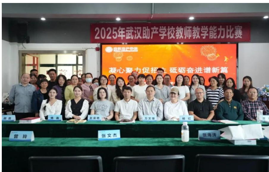
图 8-1 “凝心聚力促招生 砥砺前行开新局” 招生表彰大会现场