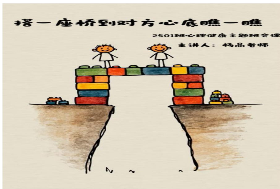
图 10-3 心理健康主题班会