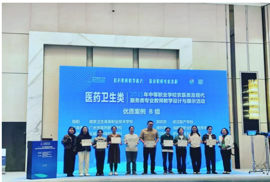
图2-9 2025年全国中等职业学校农医类及现代服务类专业教师教学设计与展示比赛获奖