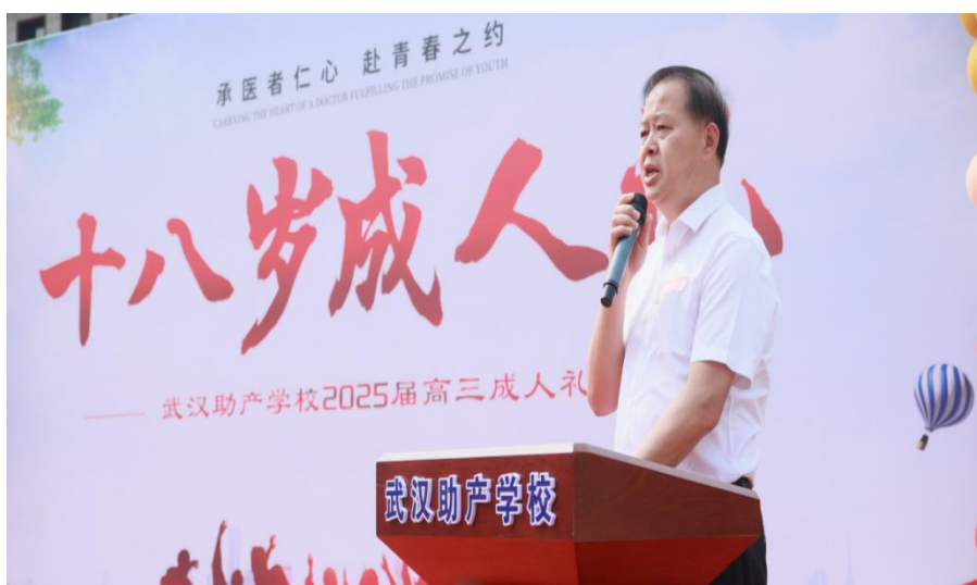
图 4-1 成人礼活动现场（一）

筑牢“医者仁心”的职业根基，为培育兼具人文素养与专业能力的护理人才赋能。学校将南丁格尔精神宣誓作为职业素养培育的核心环节，融入成人礼、实训启动等重要场景。师生高举右拳庄严宣誓，承诺恪守“忠贞职守、救死扶伤、关爱生命、无私奉献”的职业准则。庄重的宣誓仪式，既让南丁格尔精神根植于心，更强化了学生的职业使命感与道德坚守，为成长为有温度、有担当的护理从业者注入精神力量。