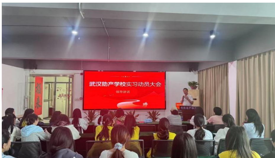
图 8-2 武汉助产学校白衣天使的成长之路

校企深度合作模式是产教融合的重要实现形式，学校认真贯彻上级文件精神，与武汉大学中南医院、武汉市第六医院、武汉科技大学汉阳医院、盛世天爱体检中心等 7 家优质医疗机构实现实习就业合作，其中盛世天爱体检中心是 2025 年新增的实习基地。医院除了为学生提供临床实习的岗位，还承担了临床教学工作，与学校达成了教学合作意向，在学生学习理论知识的同时，选派优秀临床医护工作者来校手把手教授学生专业技能，不仅满足了学生技能实训，同时也为学生的实习就业打下坚实基础。同时学校成立了专业建设指导委员会，由学校专业带头人、骨干教师和医院专家共同组成，定期举行专题会，就专业建设、教材开发、师资培养等问题进行探讨。通过校企合作促进专业与岗位的无缝对接，并共同培养师资队伍，全面提升了在校教师的教学水平。