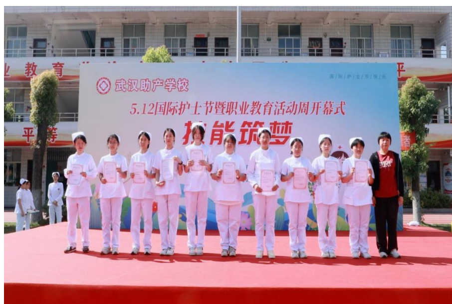
图 4-7 “5.12 护士节”主题活动现场（一）