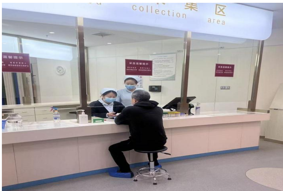
图 5-2 体检现场（二）