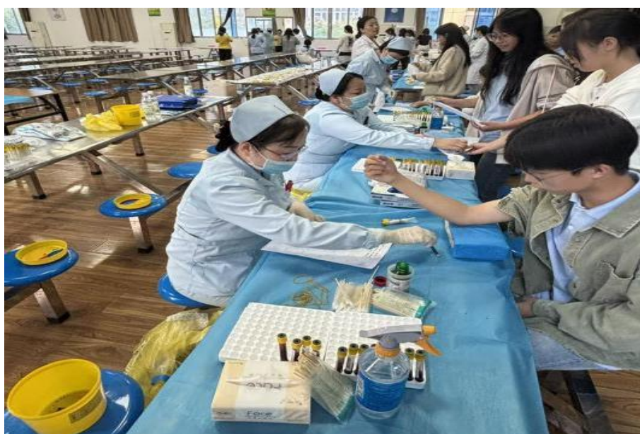
图 5-1 体检现场（一）

2025 年，学校与盛世天爱体检中心正式达成深度合作，开启校企协同发展新篇章。合作框架下，盛世天爱将为全校师生提供专业、全面的体检服务，以精准医疗检测守护师生健康。同时，中心挂牌成为学校教研基地，为教师搭建临床实践与教学研究的联动平台，助力教学内容与行业需求接轨；还将作为学生实习基地，提供沉浸式岗位实践机会，帮助学生积累实操经验、提升职业素养。此次合作实现资源互补、多方共赢，为师生健康保障与人才培养注入强劲动力。