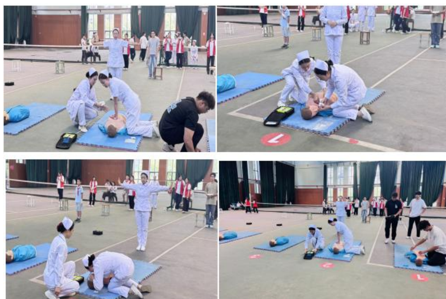
图 2-15 学校护理教师和学生比赛现场