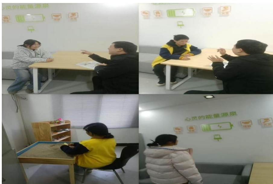
图 10-1 学生在心理咨询室接受心理咨询指导中

室建设的具体要求，结合学校实际，2025 年，学校建立心理咨询室，配备心理咨询教师，关注学生心理健康，将心理服务纳入学校发展规划。高度重视学生心理工作，每年新生入学对学生进行全面筛查，并建立干预、转介等机制，定期开展心理普查，适时做好心理咨询服务，及时做好心理疏导，同时，开设心理课程系统讲解情绪调节、压力应对等实用知识，心理班会搭建互动交流平台，师生共同探讨成长困惑，为身心健康提供切实支持。建立学校与家庭、与社会一起共同关心关注学生心理工作，以促进学生的身心健康。