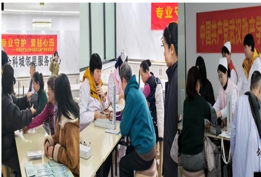
图 3-3 师生携手开展居民血压检测活动

5.慢性病管理普受欢迎。在系列活动中，慢性病管理内容受居民欢迎，在血压检测区，5组“师生搭档”流水线作业：学生负责测量、记录，老师负责解读、指导，对 27 例血压 \geq 140/90\text{mmHg} 的居民，并帮助社区建立“社区一家庭”两方随访档案。