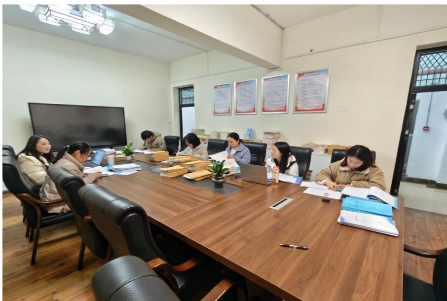
图 2-8 学校定期举办教学研讨会

育科研基金，资助教师开展教学研究项目，加速科研成果向课堂实践的转化。同时，学校与多所兄弟院校建立合作关系，常态化邀请领域专家来校举办学术讲座，持续拓宽教师学术视野。这些系统性措施使学校教学质量与科研实力获得显著提高，为学生综合素质发展提供了有力保障。