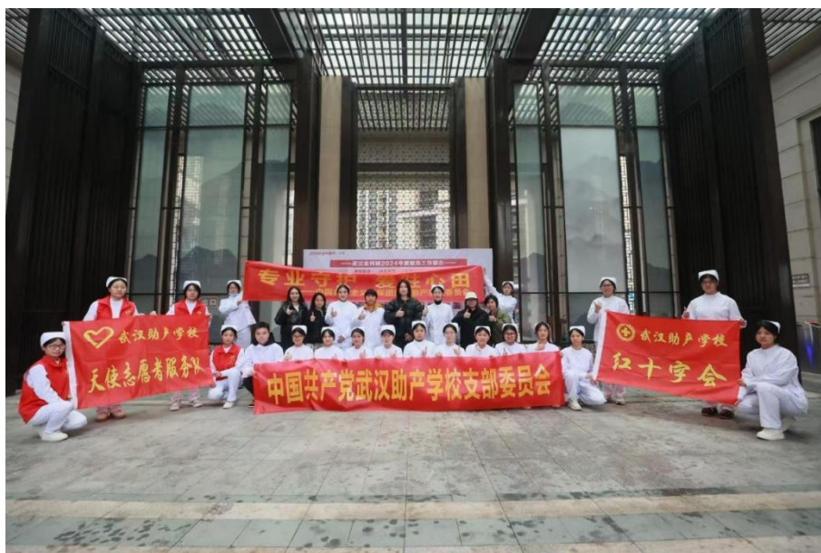
图 3-1 学校参加宣讲的全体成员

十字精神为旗帜，通过急救培训、健康监测、疾病宣讲、精神慰藉四大板块，为社区 120 余位居民送去了科学、系统、贴心的健康服务，实现了“学生受教育、群众得实惠、社区促治理”的三重目标，标志着学校“校社共建、德技并修”育人模式再上新台阶。