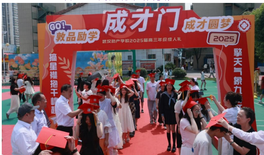
图 4-2 成人礼活动现场（二）